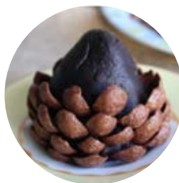
mit Krispies verzieren