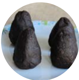
kleine Berge formen